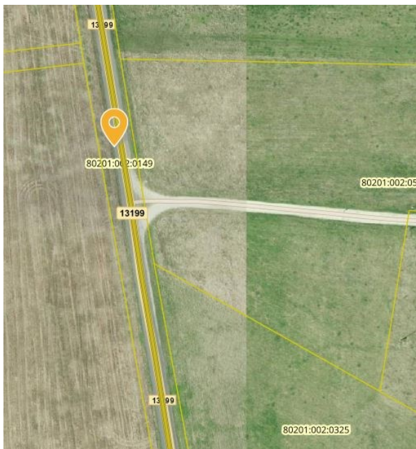
Joonis 2. Koolibussipeatuse asukoht riigitee nr 13199 km 1,45 (vasakul), väljavõte Maa-ameti geoportaalist